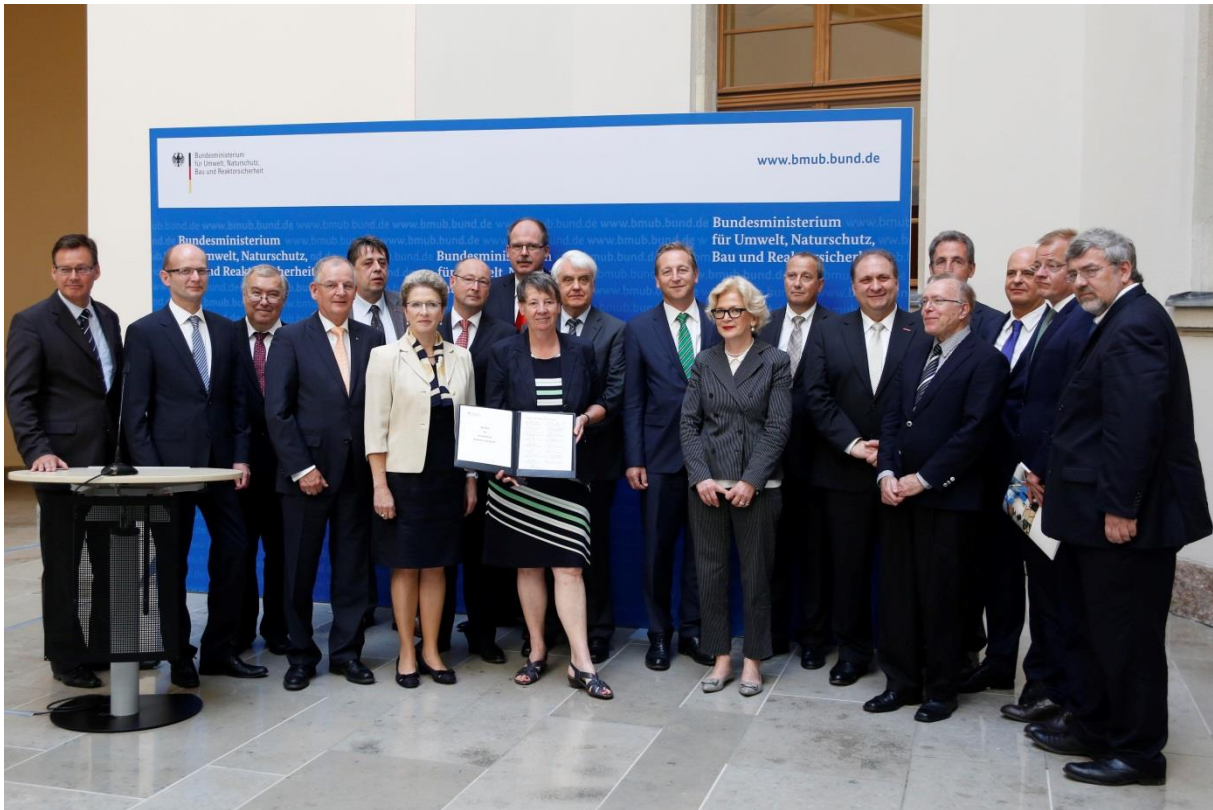
Abbildung 1: Bundesbauministerin Dr. Barbara Hendricks mit den Repräsentanten des Bündnisses für bezahlbares Wohnen und Bauen nach Unterzeichnung der gemeinsamen Erklärung im Rahmen der Auftaktveranstaltung am 10. Juli 2014.

Länder finanziell bis Ende 2019 über die so genannten Kompensationsmittel und verstärkt sein Engagement in den kommenden Jahren: 2016 bis 2019 steigen die jährlichen Kompensationsmittel um jeweils 500 Millionen Euro auf dann insgesamt 4 Milliarden Euro.